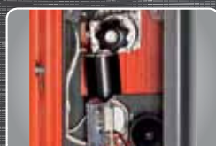
composants solides et de haute qualité pour une longue durée de vie