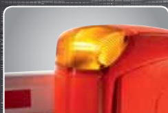
feu d'avertissement intégré