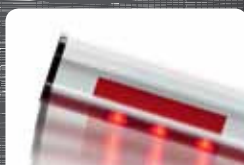
illumination LED pour encore plus de visibilité et sécurité